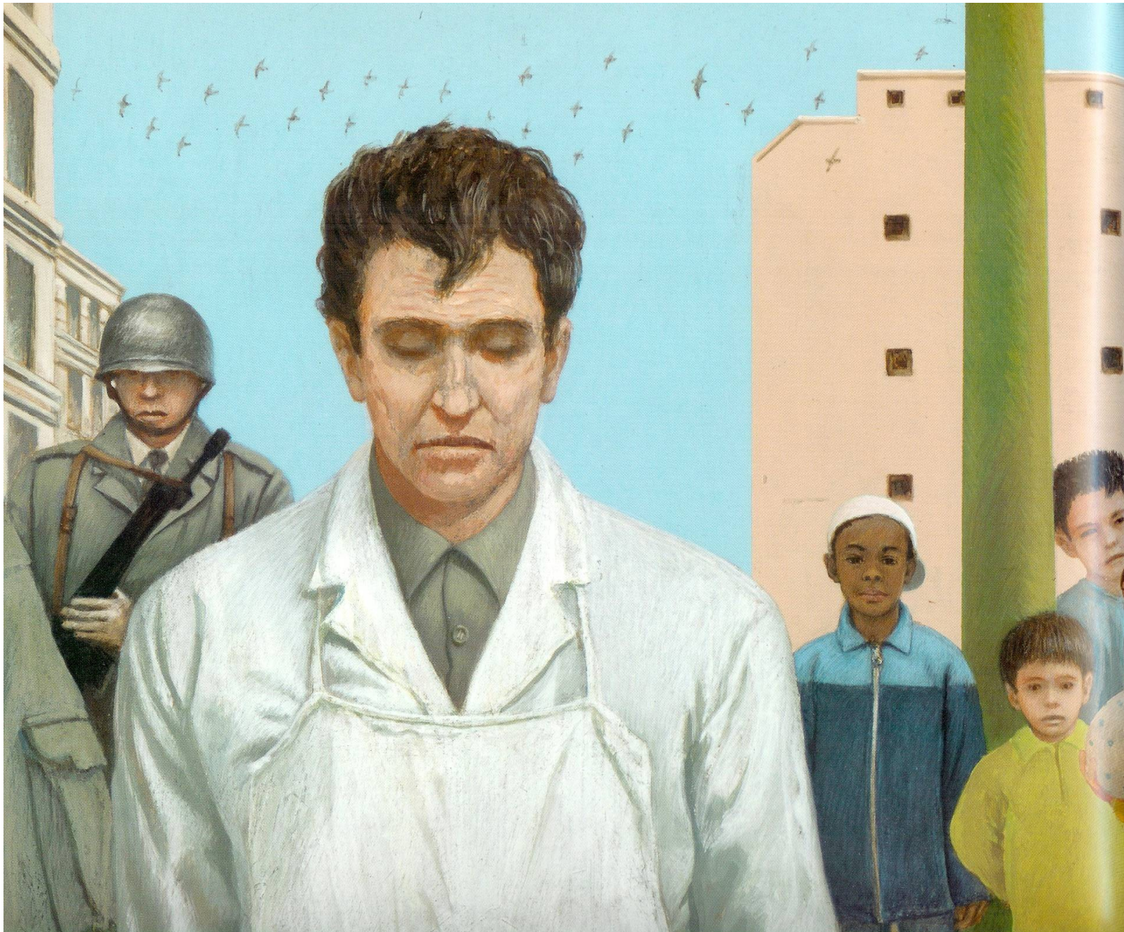
Illustration de la page 7