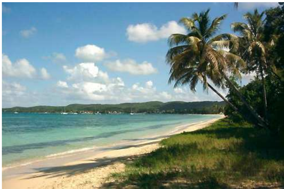
La plage de Folle Anse